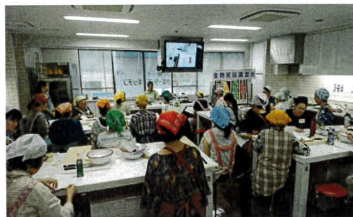
過去の講習会の様子